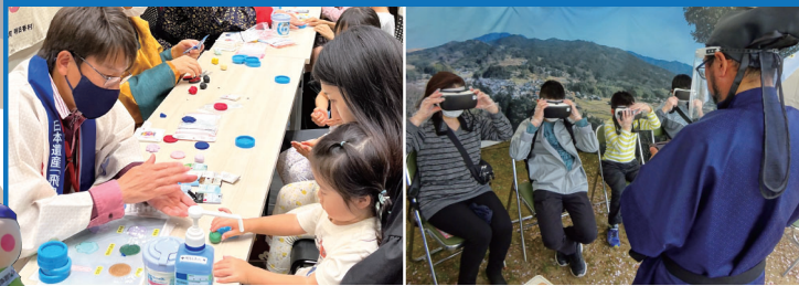
粘土ワークショップ VR体験 (旅する飛鳥京)